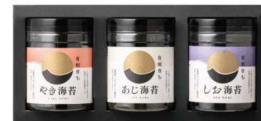
しお海苔・丸容器 化粧箱入り 3個

【内容量】8切40枚(板のり5枚)×3個 【商品サイズcm】縦11.0×横24.0×巾8.0