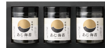
やき海苔・丸容器 化粧箱入り 3個

ふわりとした口溶けの食感と口に広がる海苔本来の旨味が楽しめ、弊社こだわりの甘辛い醤油味で仕上げました。